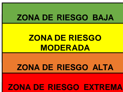
Figura 4. Matriz de Calificación, Evaluación y respuesta a los riesgos

Basados en las figuras presentadas anteriormente, se presenta el análisis del riesgo inherente para E.S.E Hospital San Juan de Dios de Pamplona: