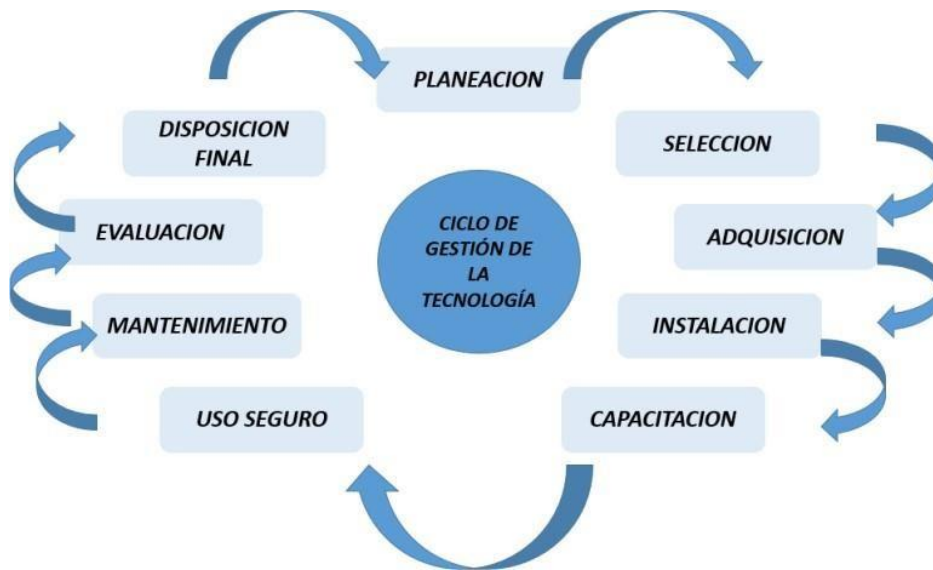
Ilustración 1: Ciclo de gestión de la tecnología

Este ciclo comprende no solo los costos asociados, el entrenamiento al personal, los aspectos éticos si no también el mantenimiento y en general las etapas necesarias para una buena adopción, instalación y mantenimiento. El uso adecuado de los recursos tecnológicos asignados por la E.S.E. Hospital San Juan de Dios de Pamplona a sus funcionarios, contratistas y/o terceros se reglamenta bajo los siguientes lineamientos: