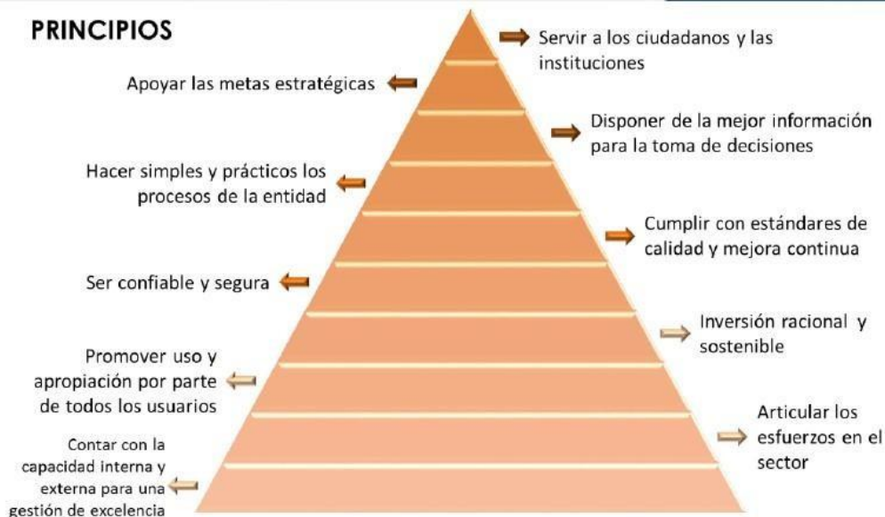
Ilustración 2: principios del Gobierno de TI

A continuación, siguiendo con el modelo de estrategia de TI, se realiza un direccionamiento organizacional en el cual se alinea la estrategia de TI con la estrategia institucional, la arquitectura empresarial o institucional se alinea con los mecanismos de Gobierno de TI, a través de políticas, acuerdos de desarrollo de servicios y de implementación de facilidades tecnológicas, los procesos de la entidad se adelantan con énfasis en la eficiencia, la transparencia y el control de la gestión y necesidades institucionales con las políticas operativas y de seguridad de la información, portafolio de servicios, arquitectura de información y sistemas de información.